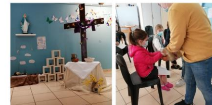
Jeu de saint : célébration du lavement des mains