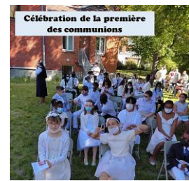
Célébration de la première des communions