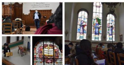
5 ème - Visite du temple protestant du Raincy

La célébration de la profession de foi : dimanche 9 juin 2024